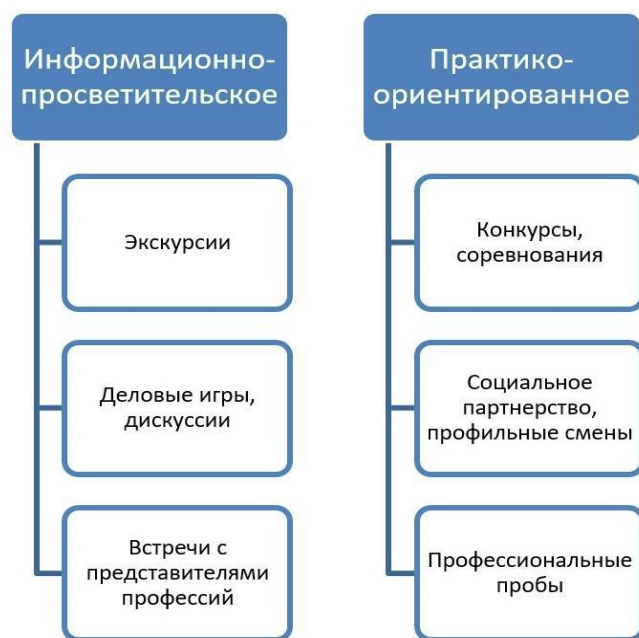
Схема 1 – Типы летней трудовой практики/профессиональных проб обучающихся 8-9 классов

8 - 9 классы: расширение знаний о профессиях и предъявляемых ими требований к человеческим качествам; формирование и уточнение образовательного запроса соответствующего интересам и способностям (в т.ч. в ходе профильной подготовки); информирование о системе профессионального образования региона; групповое и индивидуальное консультирование с целью адекватного принятия решения о выборе профиля обучения в старшей школе или профессии / специальности в системе среднего профессионального образования; приобретение первоначального опыта социально-профессиональной практики - этому способствует прохождение обучающимися летней трудовой практики/профессиональных проб, которые позволяют соотнести свои интересы, индивидуальные способности с требованиями, предъявляемыми профессиональной деятельностью.